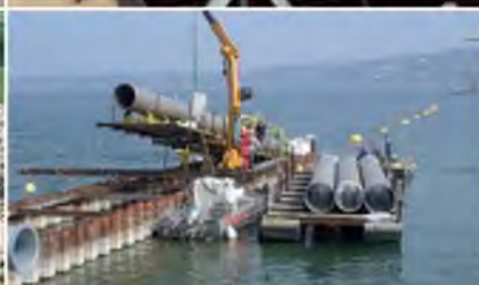
Conduite sous-lacustre dans le lac Léman (GE) Maîtrise d'œuvre