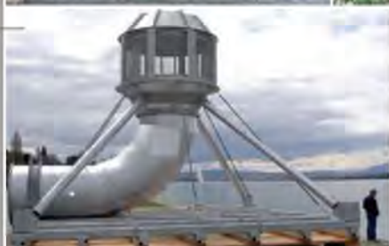
Prise d'eau sous-lacustre dans le lac Léman (CH) Maîtrise d'œuvre