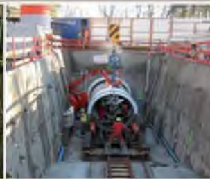
Galerie d'évacuation d'eaux usées de Chouilly, St Genis-Pouilly (01) Maîtrise d'œuvre