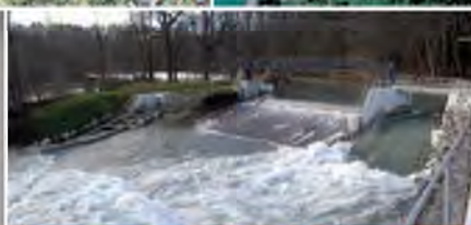
Barrage de Vessy (CH) Maîtrise d'œuvre