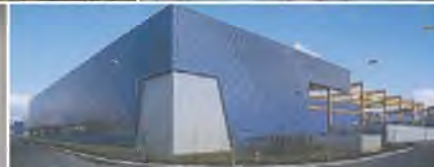
MAGESI Malley Renens Maîtrise d'œuvre