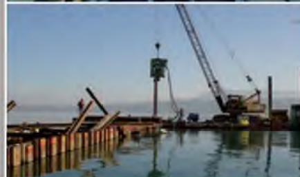
Travaux lacustres pour l'atterrage d'une conduite d'eau brute Maîtrise d'œuvre