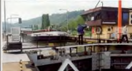
Écluse de Grevenmacher sur la Moselle Luxembourg Étude de sécurité