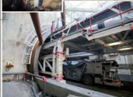
A41N Tunnel du Mont Sion (74) Assistance à Maîtrise d'Ouvrage