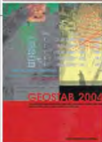
■ GEOSTAB, un logiciel développé par GEOS pour le dimensionnement des talus