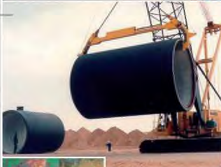
■ Great Man Made River Project, Lybie Études géotechniques