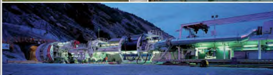
Tunnel ferroviaire du Lötschberg (CH) Maîtrise d'œuvre