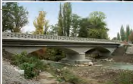
Reconstruction du pont sur l'Allondon (CH) Maîtrise d'œuvre