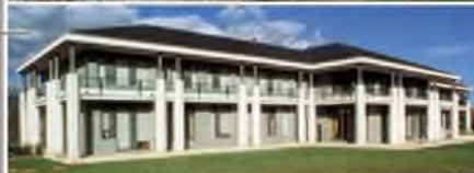
TEMTRADE Chambésy (GE) Maîtrise d'œuvre