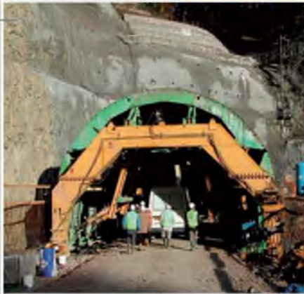
■ Tunnel et nouveau pont de l'Église à Reyvroz (74) Études d'exécution