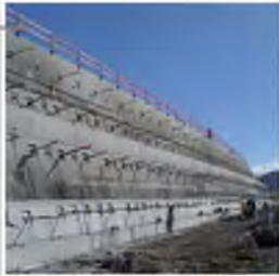
■ A41N Murs ancrés de Troinex (74) Assistance à Maîtrise d'Ouvrage