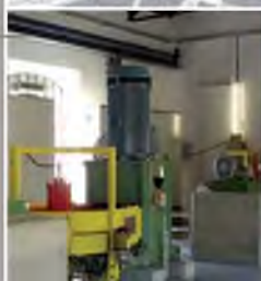
Groupe turbo-alternateur de l'usine hydro-électrique de Vessy (GE) Maîtrise d'œuvre