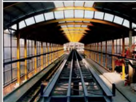
Centre de nettoyage principal CFF (GE) Maîtrise d'œuvre