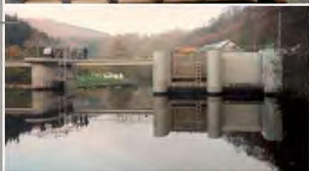
Barrage sur la Sure Luxembourg Diagnostic et étude de sécurité