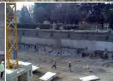
■ Parking Montessuit Annemasse (74) Études d'avant projet