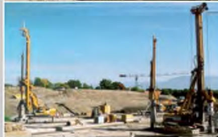
■ Station de traitement d'eau des Tuileries (GE) Études géotechniques et maîtrise d'œuvre