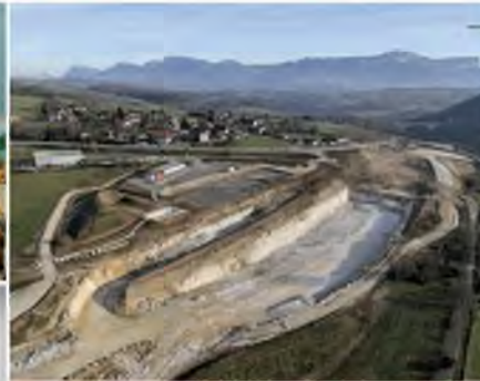
■ A41N Tranchée Couverte de Noiret (74) Assistance à Maîtrise d'Ouvrage