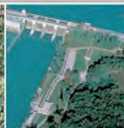
Passé à poissons au barrage de Verbois (GE) Maîtrise d'œuvre