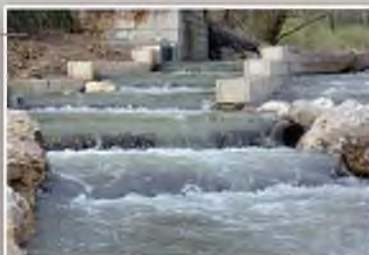
Passé à poissons sur l'Allondon (GE) Maîtrise d'œuvre