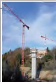
A41N Viaduc des Ussets (74) Assistance à Maîtrise d'Ouvrage