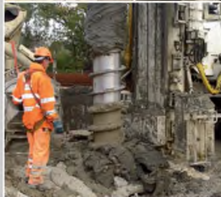
■ Pieu Foré à la tarière creuse