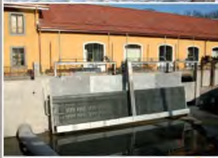
Usine hydro-électrique de Vessy (GE) Maîtrise d'œuvre